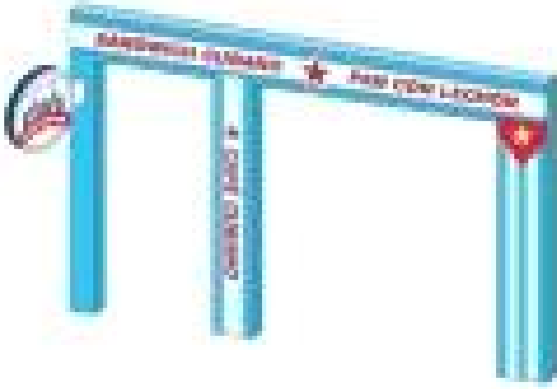
[디자인 특허 출원된 카페쿠바노 외부 간판 디자인] 출원번호 : 30-2021-0010392